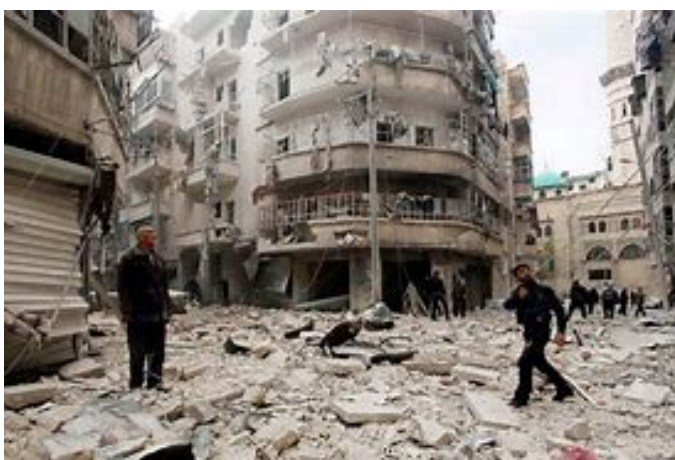
Ciudad de Alepo en guerra (Siria)

A su petición, se presentan los diversos grupos presentes y hace la pregunta cómo ve cada grupo a la FaSa. Hay respuestas. Un peligro expuesto es que se puede entrar en el grupo, encerrarse y olvidarse que existe la calle. Otras personas a título personal expusieron que se encuentran felices con lo que reciben en su grupo. F. Pintor