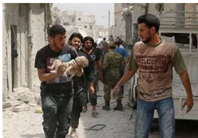
Tragedia en Alepo (Siria)