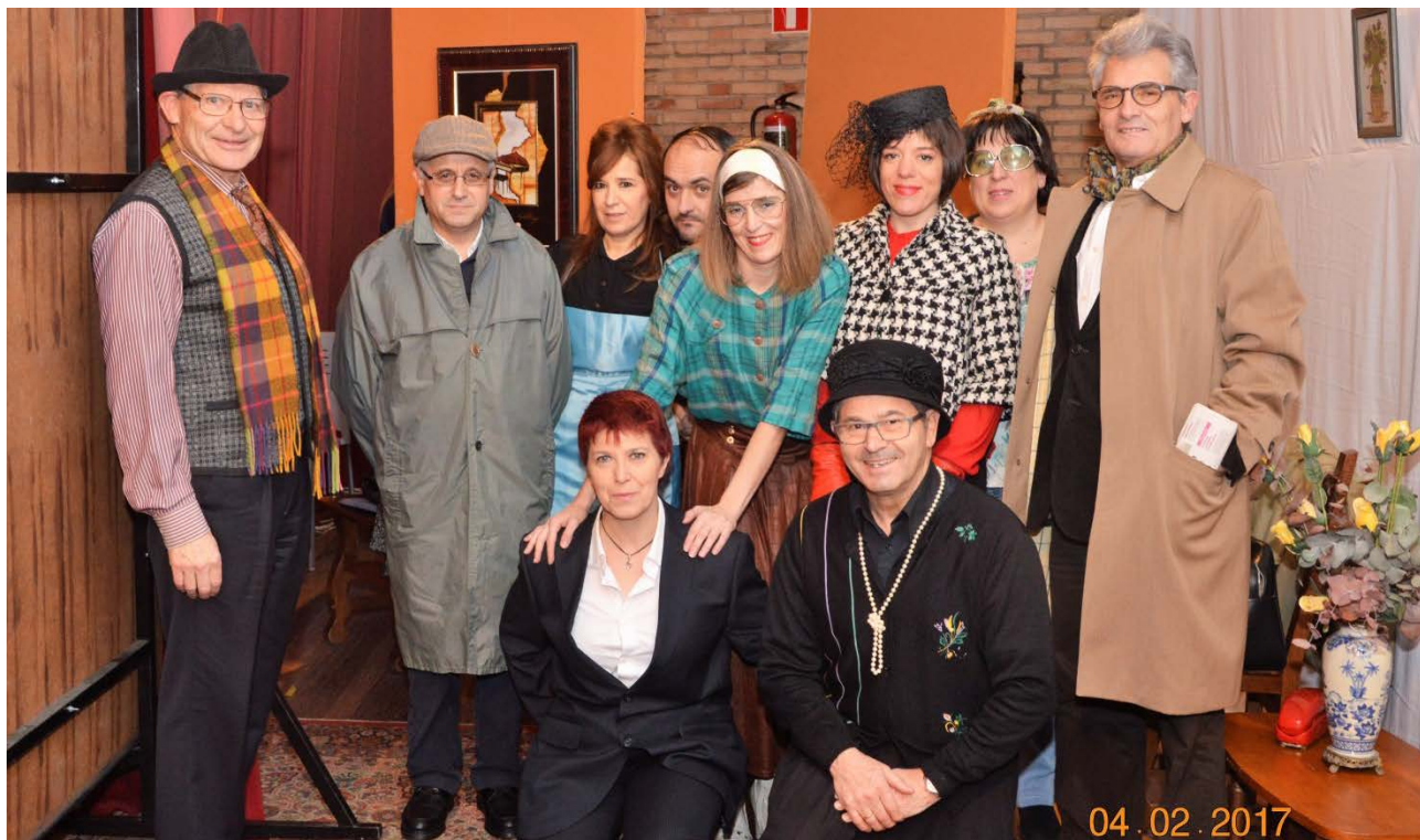
Cuadro artístico “LOS PANDILAS” Antiguos Alumnos Salesianos.

Ya tenemos trabajo hasta el año que viene: Ser y sentirnos Familia. Ser y hacer de D. Bosco . Gracias a todos los que han colaborado para que este día saliera bien y así honrar a D. Bosco.